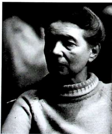
Simone de Beauvoir