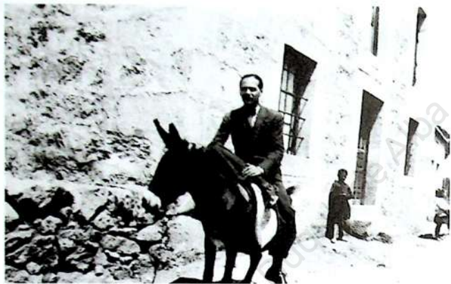
Luis Cernuda montado en burro, Julio 1932, Burgohondo (Ávila).