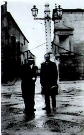
Luis Cernuda y José Val del Omar en Ávila, 12/10/1932.