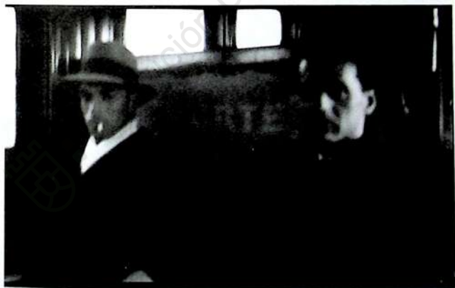
José Val del Omar y Luis Cernuda en un tren, Octubre 1932, Ávila.