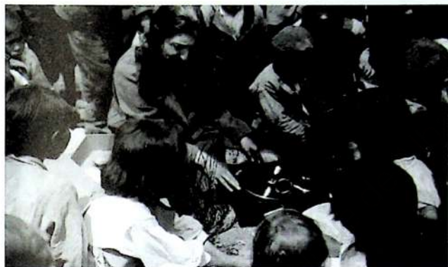
Sesión de Música en Navarrevisca.

Ante el cuadro de Santa Isabel de Hungria. (Al fondo "Las Hilanderas". Cebros, Ávila [Ca. 1932].