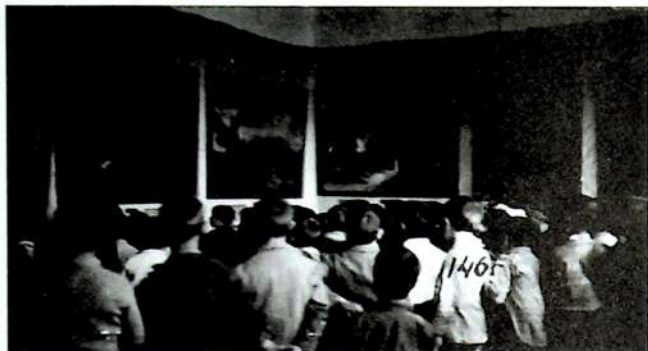
Los niños de las escuelas visitan el Museo Circulante en Cebreros (Ávila), [13-16 de noviembre de 1932].