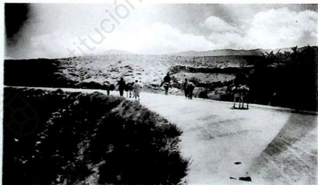
Luis Cernuda (el último de espaldas. Archivo de la Residencia de Estudiantes, Madrid