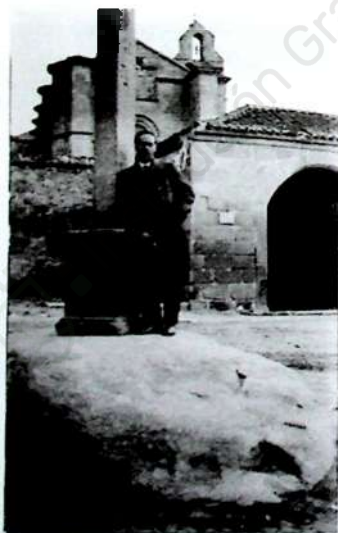
Luis Cernuda en Ávila, 12/10/1932.