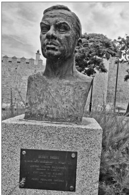
Foto 3. Busto de Rubén Darío, en los jardines del Rastro, en Ávila.