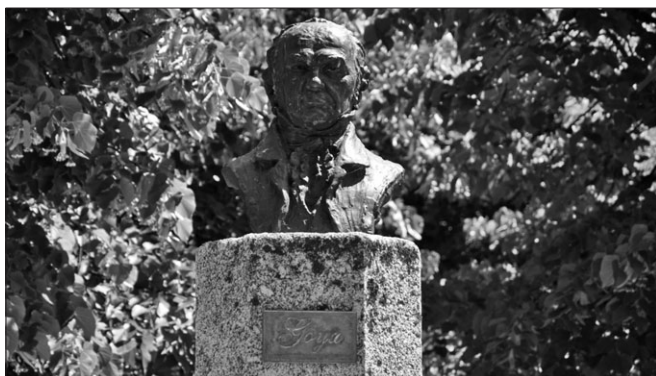
Foto 4. Busto de Goya, en los jardines del Palacio de los Duques de Alba, en Piedrahíta.

Piedrahíta disfruta de su busto de Goya y del interesante Mascarón , un rostro mitológico que adorna la fuente principal del estanque de los jardines del palacio de los Duques de Alba desde 1964 y que le fue encargado por el Ayuntamiento, con el fin de sustituir el original desaparecido en 1812 con motivo de la guerra de la Independencia, según comenta su sobrino Ramón de Santiago.