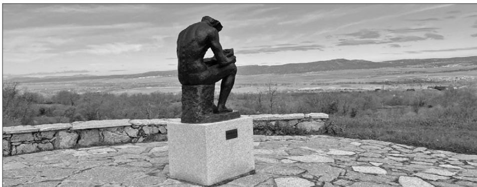
Foto 5. Analiza, en el Mirador de la Era, en Navaescorial.