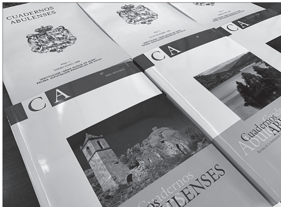
Fig. 2. En esta imagen se puede apreciar el cambio en la cubierta, que tuvo lugar a partir del número 31.

Como señalamos anteriormente, el área que más investigaciones reúne es la que presentamos como Historia y documentación, con un total de 126 artículos (el 36,6 %), que reflejan la vocación historiográfica y divulgadora de gran parte de los firmantes, la mayoría miembros de número y colaboradores de la propia Institución. Las entregas abordan todas las épocas y temáticas (personalidades, conflictos, episodios, prensa y comunicación, documentos...), con especial atención a la Edad Media y Moderna, pero también con trabajos sobre Contemporánea.