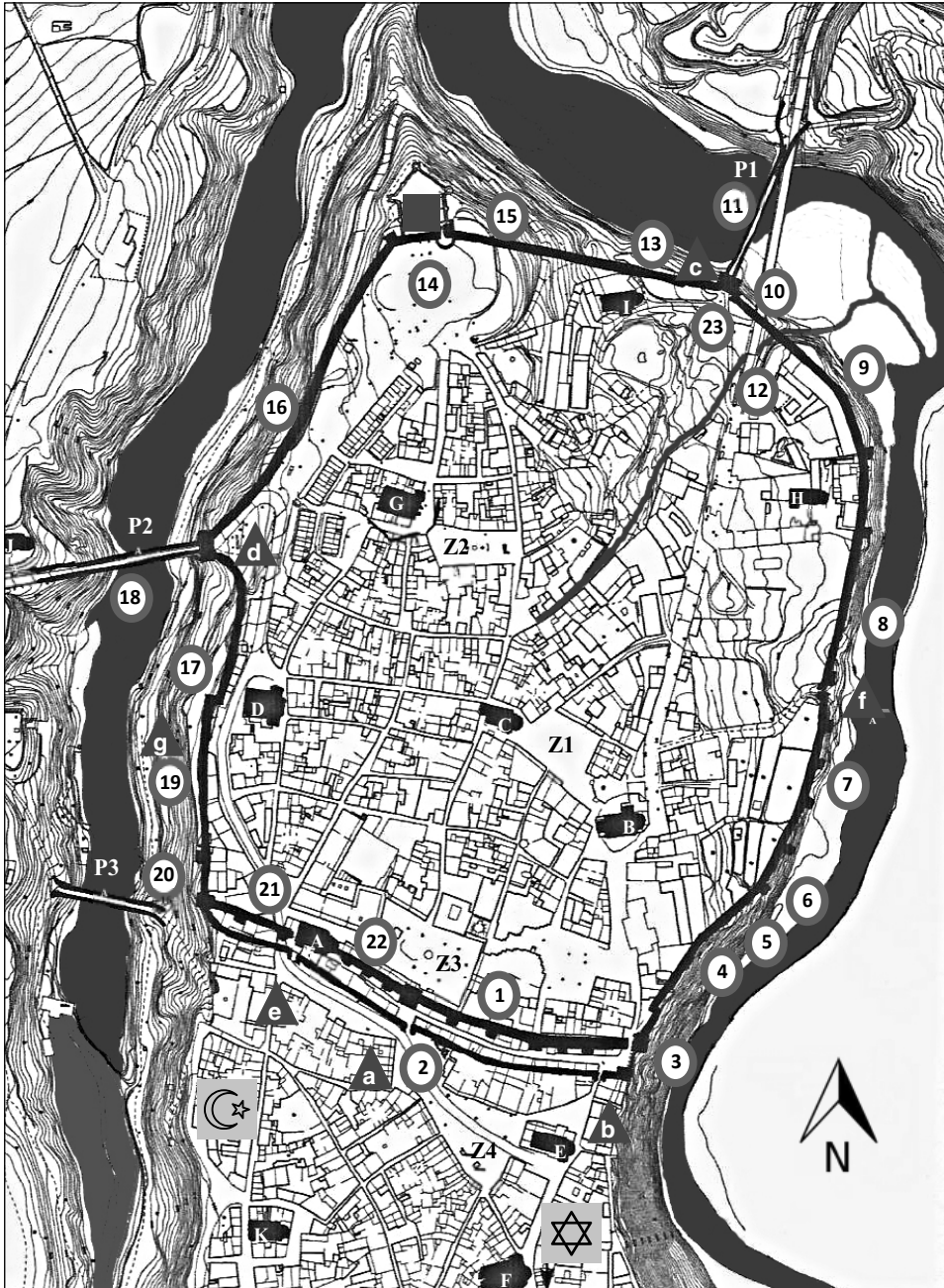
Plano de Arévalo, con los puntos a reparar según el testimonio notarial de Pedro de Vadillo (doc. 26).