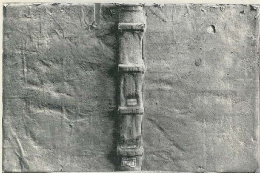
Fig. 3: [230, 231]

encuadernados en piel, por lo general muy deteriorada, también sobre tabla e igualmente con huellas de cadena (véase la Fig. 3). Todo el conjunto tenía cierto aire de familia, pero no lograba determinar su procedencia. No sospechaba en ese primer momento que muchos volúmenes que habían pertenecido a ese mismo conjunto ya no conservaban su primitiva encuadernación y que incluso algunos de los volúmenes facticios habían sufrido una agresión inexplicable: se les había destruido como piezas históricas, al haberse separado, dentro de la propia Biblioteca Nacional, los ejemplares que desde antiguo habían compartido una misma encuadernación.