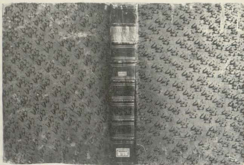
Fig. 2: [197]