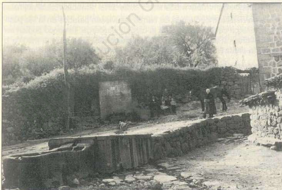
Fig. 4.—Imagen de los hoy inexistentes pilones de la Fuente de San Bartolomé de Casavieja

La venta de carnes y de productos alimenticios era controlada por la Comisión del Ayuntamiento. A finales del siglo XIX, la villa poseía una ca-