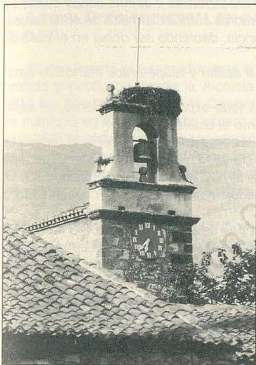
Fig. 2.—Imagen de la Torre del reloj, que era parte del edificio del Ayuntamiento de Casavieja en la Plaza del reloj

De 1848 datan una de las, hasta ahora, primeras ordenanzas 6 de Casavieja 7 ; cuyo Ayuntamiento estaba situado en la Plaza del Reloj, que en esas fechas era casi el centro de la villa.