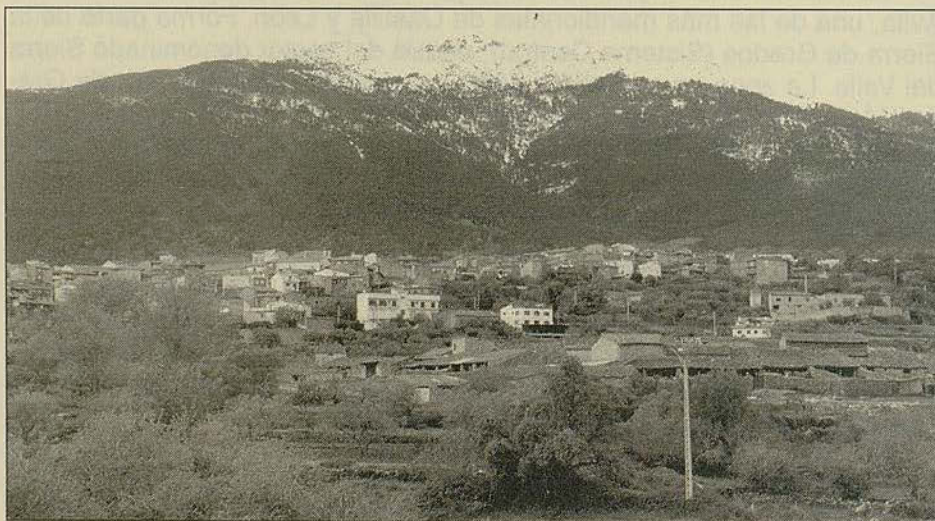
La villa de Casavieja

El estudio del proceso existencial de las rondas de Casavieja y sus textos debe completar el conocimiento de este fenómeno tradicional en el