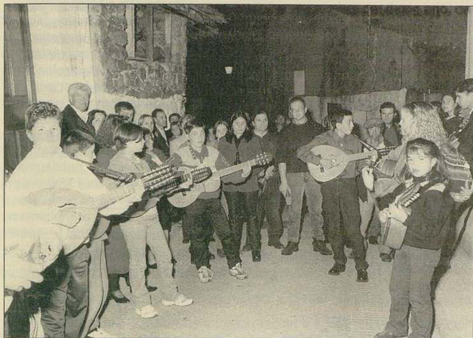
Rondas de Casavieja. 1999.

El propio objeto de la copla la hace intrínsecamente móvil, por lo que en la mayoría de los casos no puede hacerse exclusiva de una población 19 . Puede afirmarse que no existen grandes barreras para que las coplas pasen de unas localidades a otras, siendo las únicas excepciones aquellas que hagan referencia a topónimos o hidrónimos propios (Casavieja, Zarzosa, ...). No ocurre lo mismo con los Romances u otros textos que en la actualidad no poseen tanta movilidad geográfica, sino que son más restringidos y definen el folclore de cada pueblo. Otro elemento que ayuda a la movilidad/transmisión de las coplas es la presencia de registros sonoros grabados (ya sea en formato compacto o casete), éstos hacen que puedan ser reproducidos en cualquier momento, facilitando la repetición/memorización del texto. Destacar en este sentido la influencia de los textos grabados referente al folclore castellano 20 (Lp-casete-compacto-vídeo) como elementos introducidos en las noches de ronda; por la diversidad de variables este sesgo es difícil de evaluar.