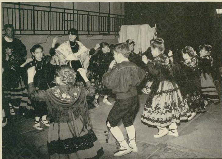
Grupo Folklórico "El Tejo".

Por lo observado in situ durante las noches de ronda en Casavieja el futuro se observa esperanzador para la continuidad de esta tradición. Sólo sería óptimo recuperar ese cúmulo de coplas que aún guardan las personas mayores, y hacer que los textos publicados fluyan al cancionero vivo.