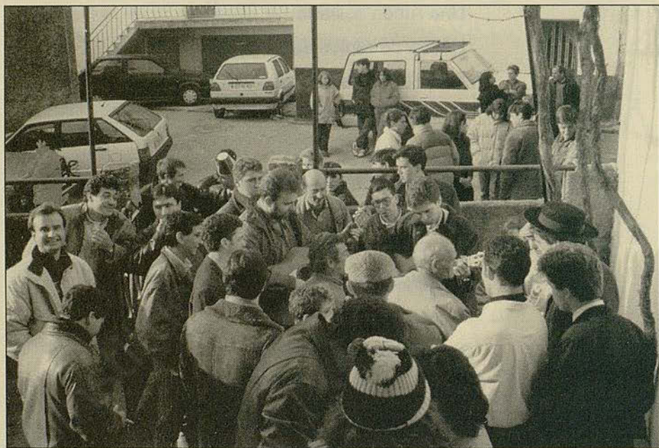
Noches de Ronda en Casavieja (1994)

Aquí viene tu galán Que dice que no te quiere Delante de mi ha jurado Que por ti la vida pierde.