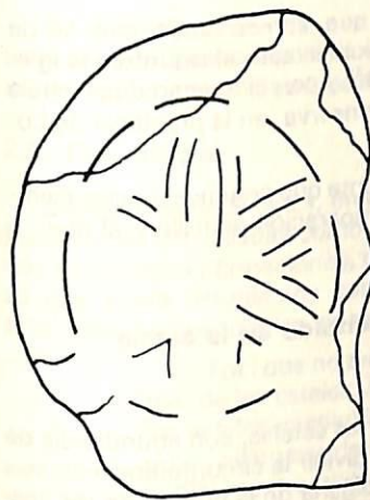
Fig. 1 AVILA N te Sra. de la Antigua Estela discoidea