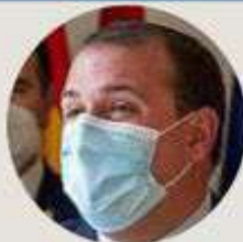
EDUARDO DUQUE DIPUTADO DE CULTURA

«Gracias a sus libros me hice abulense no sólo de corazón, también de cabeza»